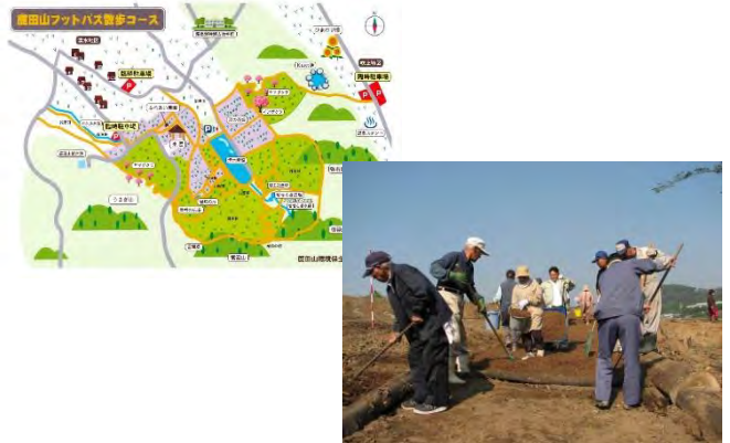
フットパスの整備