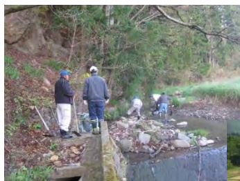
水路の維持管理風景