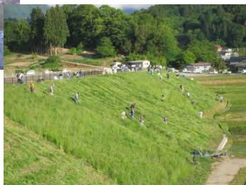
ため池の堤体の草刈り