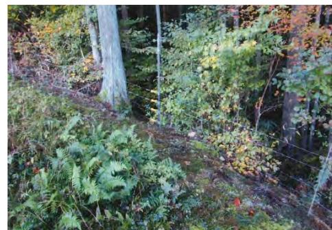
設置した獣害防止柵