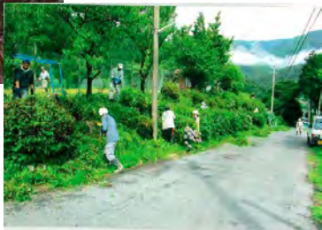
農道の草刈り風景