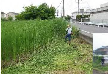
遊休農地の草刈り