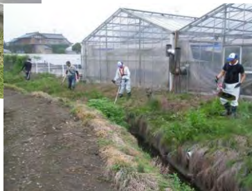
水路の泥上げ作業