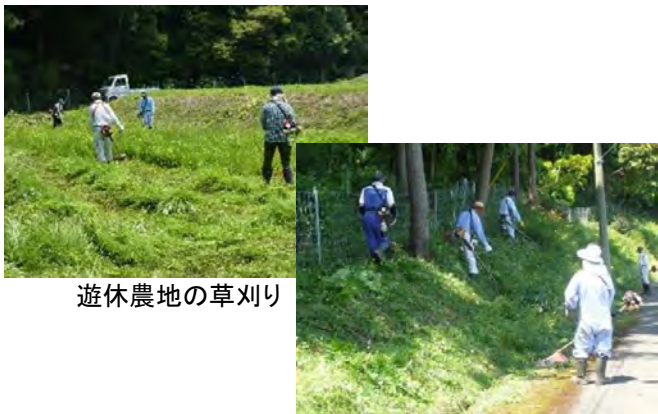
遊休農地の草刈り