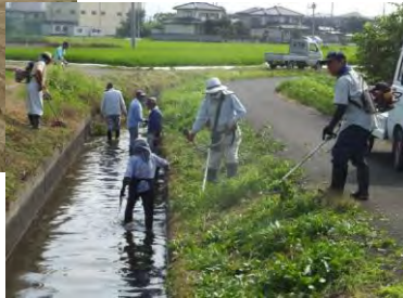
水路の草刈り作業