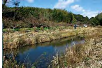
整備したビオトープ