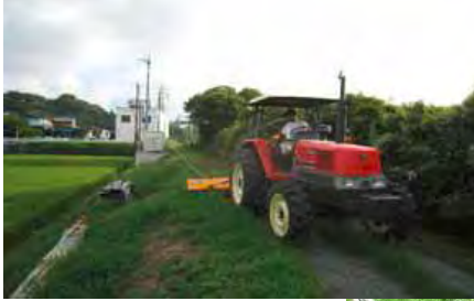
機械を活用した草刈り