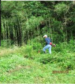
遊休農地の草刈り