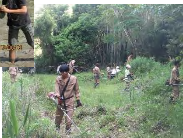
高校生との草刈り作業