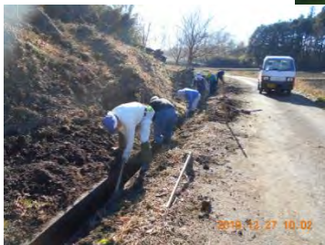
水路の泥上げ状況