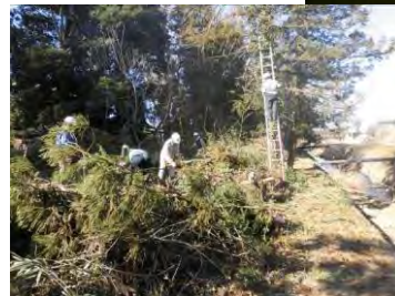
農道脇の雑木の伐採