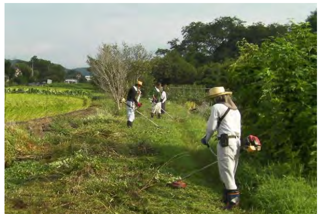
遊休地の草刈り作業