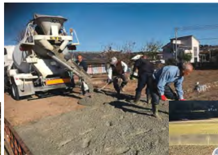
直営による農道舗装