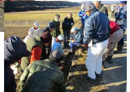
水路補修の実技研修