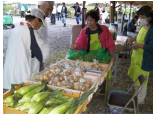
ホタルまつりでの直売風景