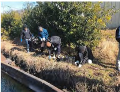
江戸彼岸桜 の植栽

○水路の更新や農道の舗装など全て直営施工で実施している。また、水路の補修の実技研修を実施し、技術の伝承を図っている。