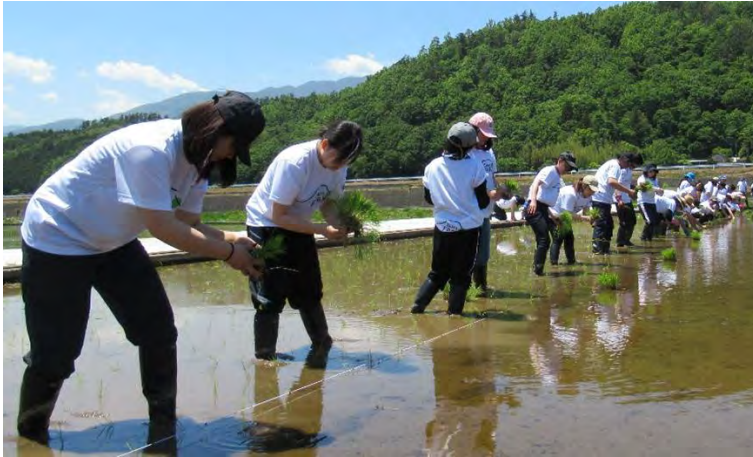
企業研修（農業体験）

○都内企業の研修（農業体験）の誘致、「小田川ホタルまつり」を開催し、都市農村交流を図っている。