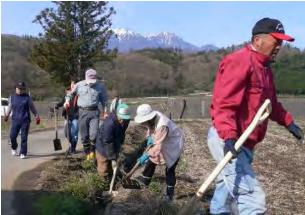
水路の泥上げ作業